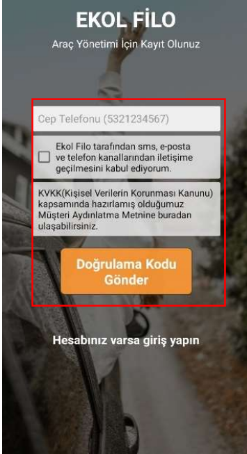
Doğrulama Kodu Ekranı

Uygulamayı ilk defa indiren kullanıcılar, sol taraftaki ilk açılış ekranı isimli ekran görüntüsü ile karşılaşacaklar, bu sayfadan en altta yazan " Hesabınız Yoksa Kayıt Olun " seçeneğine tıklayarak bir sonraki doğrulama kodu ekranına yönlendirilecekler.