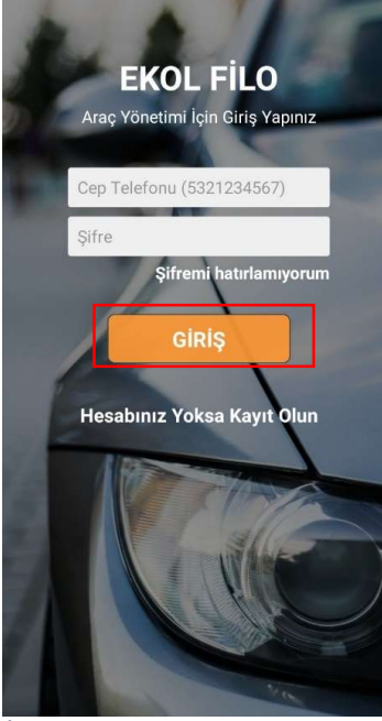
İlk Açılış Ekranı

Apple iOS kullanıcıları App Store üzerinden Ekol Filo yaparak uygulamayı indirebilirler.